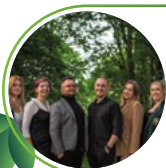
Samorząd Studentów SGGW

Lubimy ludzi z pasją, dlatego robimy wszystko, żeby pasjonaci czuli się u nas dobrze. Studenci SGGW mają możliwość realizacji swoich pozanaukowych zainteresowań w jednym z zespołów artystycznych lub sportowych.