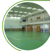
Akademicki Związek Sportowy SGGW zrzeszający zawodników w 24 sekcjach