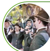
Zespół Sygnalistów Myśliwskich „Akteon”