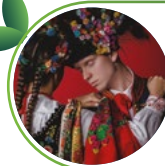
Ludowy Zespół Artystyczny PROMNI